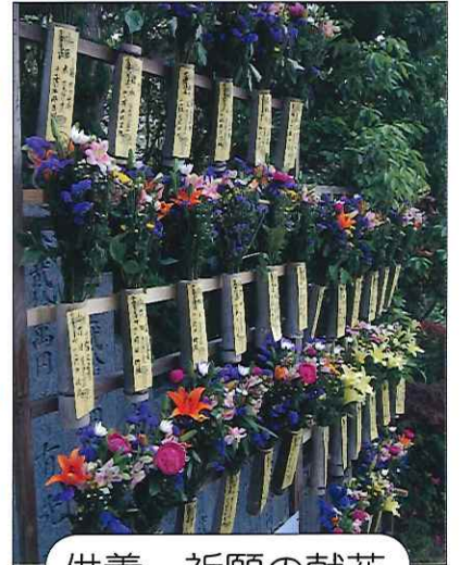
供養・祈願の献花

竹の花器は一つ一つが手作り。たくさんのお花で円福寺境内を荘厳し、曼荼羅の世界を表現いたします。