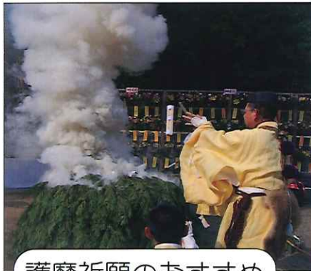
護摩祈願のおすすめ

「護摩(ごま)」は、サンスクリット語のホーマ(焼く・焚く)に由来し、また護摩の炎は仏さまの智慧を表します。